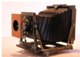
木製組立暗箱 (山田應水 使用機材) 箱根写真美術館蔵